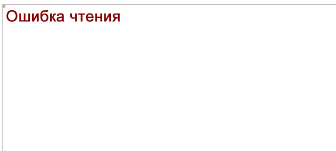
Рис. 1. Принципиальная схема тира:

В первом случае можно быть уверенным в полной безопасности, во втором - такая безопасность может быть достигнута только целым рядом дополнительно проводимых мероприятий, таких как организация оцепления, установка предупредительных табличек, ограждения и т. п.